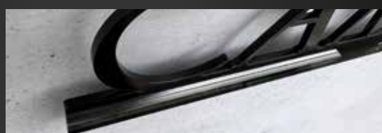
視認性を高めてくれる立体感