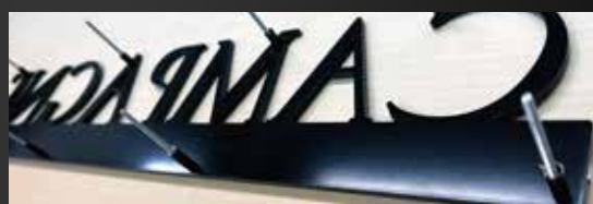
一体化されたデザインで施工もスムーズ