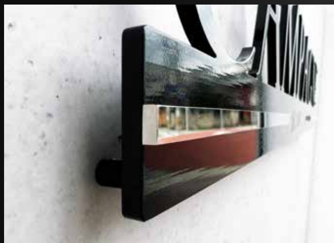
ミラーのラインがアクセント

パッと目を引くブラックの切り文字の下から、ライティングするように輝く鏡面ライン。 淡い色の壁とも相性抜群で、エントランスをシャープに引き締めスタイリッシュな印象に。 飽きのこないシンプルかつ個性的な館銘板です。