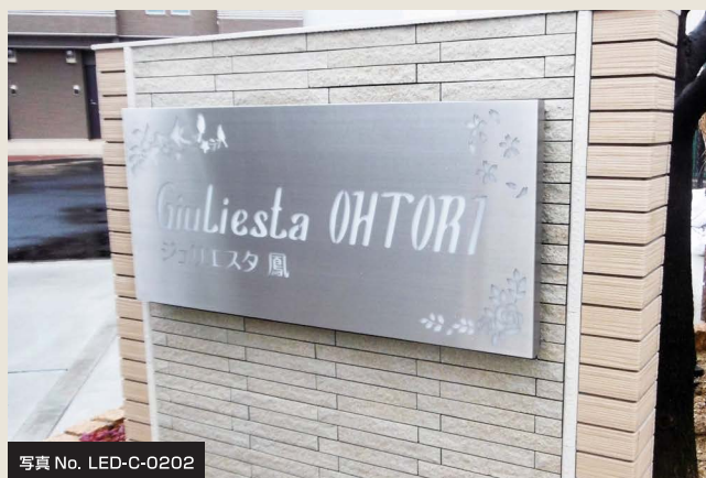
写真 No. LED-C-0202