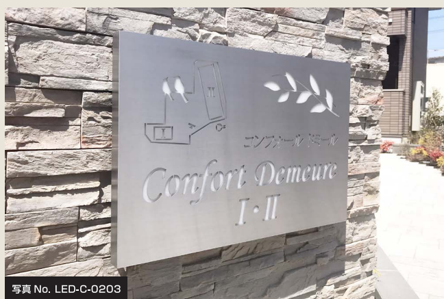
写真 No. LED-C-0203