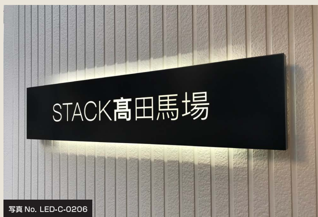
写真 No. LED-C-0206