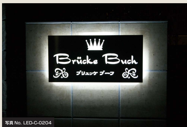
写真 No. LED-C-0204