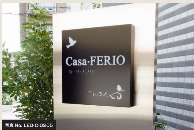
写真 No. LED-C-0205