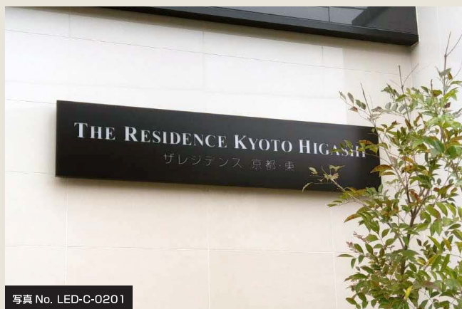
写真 No. LED-C-0201

日中はスタイリッシュに。夜間はLEDライトでラグジュアリーに。 宝石のように輝く光の文字とワンポイントが、昼夜で異なる2つの表情を演出します。