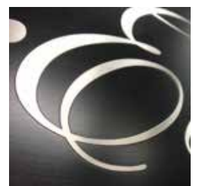
文字エッチング加工