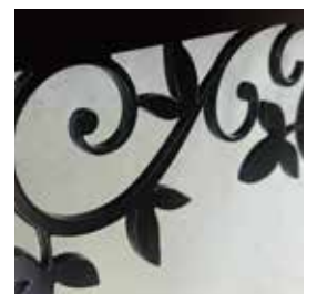
美しくカットされたステンレス